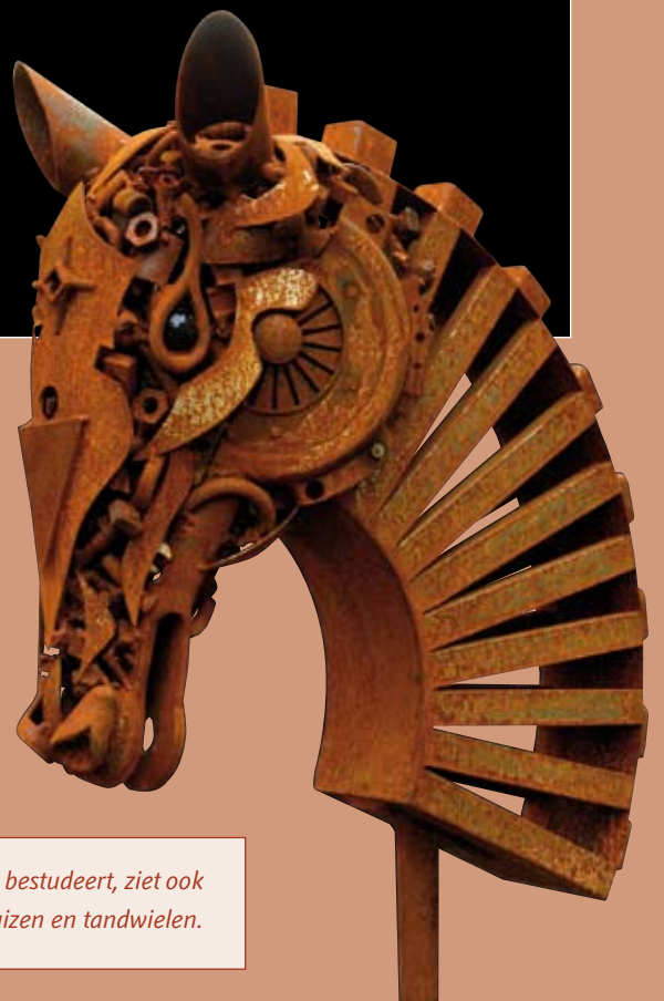
Paard. Wie vluchtig kijkt, ziet enkel een paard. Wie het paard van dichterbij bestudeert, ziet ook al die bijzonderheden waaruit het paard is opgebouwd: vijzen, moeren, buizen en tandwielen.